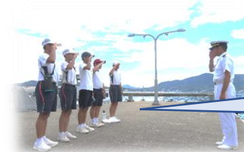
《海上自衛隊第一術科学校》