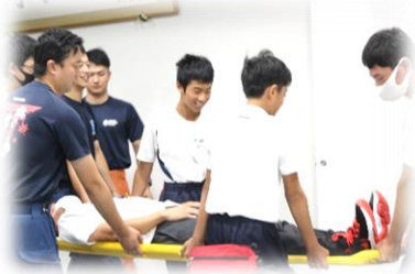
《江田島市消防本部》