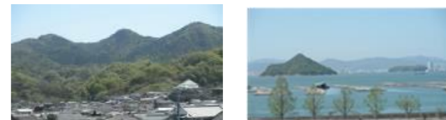
【校舎から見える「山・海・島」】

★木曜日の学力補充は、タブレット等を使用して、個に応じた課題を自学で進める(必要に応じて個別指導を行う)。