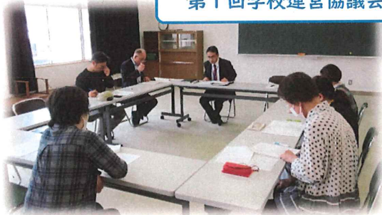
第1回学校運営協議会

もう一つの取組として、「学校支援ボランティア制度」です。1学期の間に、子どもたちの安全や学びの充実のために、保護者・地域の方々のお力添えをいただくことができました。ありがとうございました。