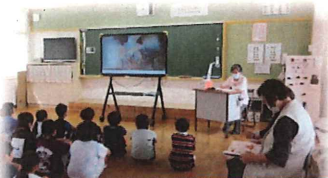
読み聞かせボランティア